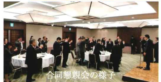
合同懇親会の様子